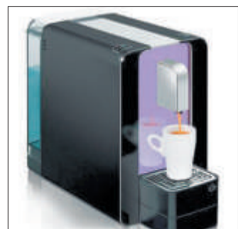
Selbst gebrüht: Kaffee mit Vanillegeschmack. PD

Ein besonderes Erlebnis für jeden Kaffeeliebhaber ist die neue Delizio-Sorte Vaniglia. Der dezente Vanillegeschmack macht den Espresso zu einem kleinen Dessertlebnis. Erhältlich ist die Limited Edition Vaniglia exklusiv bei Office World und Fust. Flavoured Coffees – oder aromatisierte Kaffees – werden immer beliebter und sind heute in jeder guten Kaffeebar zu finden. Ab jetzt kann man sich aber auch zu Hause oder im Büro seinen aromatisierten Kaffee ganz einfach selbst brühen. Vaniglia-Kapsel in die Delizio-Maschine und fertig. Den Delizio mit Vanillegeschmack geniesst man am besten mit etwas Milch oder Rahm und einem Löffel Zucker. PD