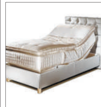
Divina-Matratze auf Schramm-Polsterbett bei Betten Thaler. PD

Über 80 Jahre Handwerks-tradition, dazu fünf Jahre Entwicklung und Feinarbeit: Divina, die Manufakturmatratze, setzt europaweit neue Massstäbe mit spürbar mehr Komfort. Die handwerkliche Funktionalität, natürliche Flexibilität und das unvergleichliche Bettklima ist für eine Zielgruppe gedacht, deren Ansprüche im Komfort- und Luxusbereich keine Kompromisse zulassen.