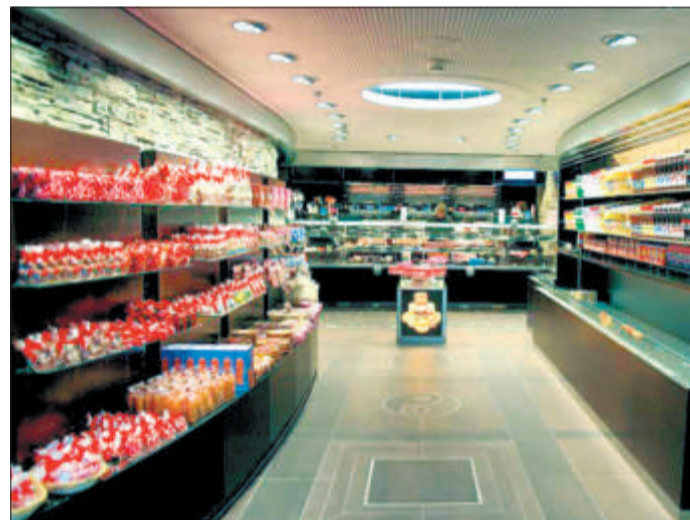
Im Bahnhof Luzern, Gleis 3, eröffnete Raymond Bachmann eine weitere Gourmetbäckerei.